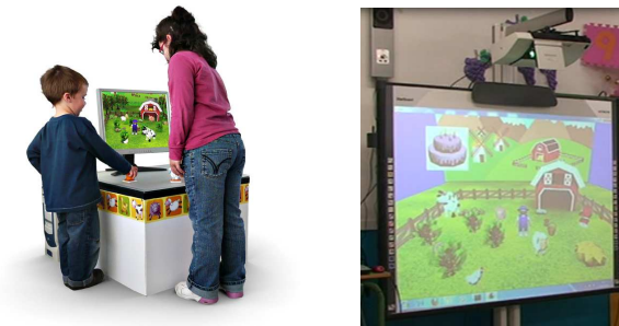
Fig. 1. Interfaz TUI (izquierda) e interfaz táctil (derecha)

La interfaz tangible se compone de un tabletop horizontal (NIKVision) especialmente diseñado para niños, con unas dimensiones de 60x40 cm de área de juego, y 45 cm de altura. La interacción con los juegos se realiza mediante la manipulación física de juguetes sobre la mesa. El dispositivo tiene una salida activa de imagen en dicha superficie y a través de un monitor adyacente al tabletop. Técnicamente [17], NIKVision utiliza un software que sigue la posición y orientación de los juguetes en la superficie, a través de un marcador impreso a la base de los juguetes. Varios niños pueden jugar al mismo tiempo en NIKVision, manipulando activamente los juguetes, que aparecen representados virtualmente dentro de un escenario 3D en el monitor. Los niños activan diferentes animaciones y sonidos moviendo los juguetes en áreas marcadas por proyección en la superficie de la mesa.