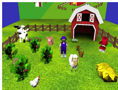
Fig. 2. Escena del juego de la granja

Se ha diseñado un juego común para ambos dispositivos interactivos: el Juego de la Granja (Fig. 2). Éste se compone de un objetivo final, varios sub-objetivos, personajes controlados por el jugador, personajes autónomos y objetos interactivos.