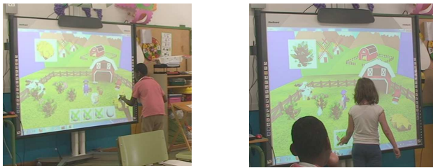
Fig. 4. En táctil, el niño pulsa la gallina para poner un huevo (izquierda) y la niña intenta interactuar con los iconos pulsándolos (derecha).

En la versión táctil, un problema de usabilidad que se advierte en el niño de la primera pareja es que tiende a pulsar en el animal para ejecutar las acciones (en vez de pulsar en el objeto), cosa que el sistema no contempla (Fig. 4 izquierda). Además, un problema generalizado es la dificultad para completar la tarea de recoger fresas, ya que los niños no perciben claramente las fresas situadas en los fresales.