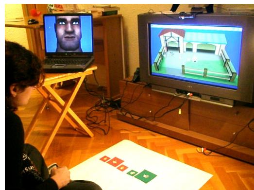
Figure 3: Sistema con agente autónomo.

Los elementos tangibles que el niño distribuye en su escritorio se verán como representaciones 3D en la pantalla de TV. Dependiendo del juego desarrollado podrán ser casas, animales, personas, que interactuarán entre ellos y responderán coherentemente a las acciones del niño. Mientras, el agente pedagógico planteará retos y objetivos, aportará información pedagógica, y responderá según las acciones del niño guiando, corrigiendo y ayudando (ver figura 3).