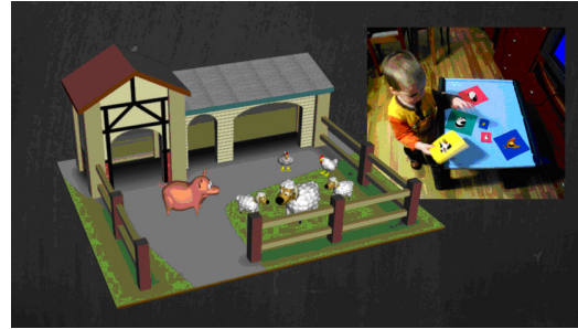
Figure 5: Escritorio representado virtualmente.

NIKVision y pretende poner de manifiesto la viabilidad técnica y las potencialidades lúdicas y educativas de un sistema como el desarrollado. Se trata de un punto de partida sobre el que estudiar nuevas funcionalidades y aplicaciones.