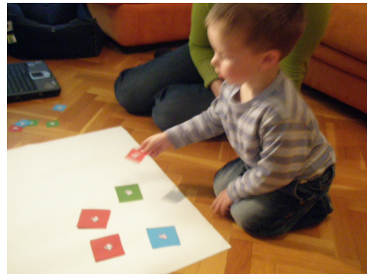
Figure 2: Elementos tangibles.

Los elementos tangibles que el niño distribuye en su escritorio se verán como representaciones 3D en la pantalla de TV. Dependiendo del juego desarrollado podrán ser casas, animales, personas, que interactuarán entre ellos y responderán coherentemente a las acciones del niño. Mientras, el agente pedagógico planteará retos y objetivos, aportará información pedagógica, y responderá según las acciones del niño guiando, corrigiendo y ayudando (ver figura 3).